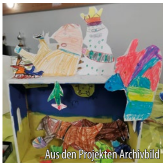
Aus den Projekten Archivbild